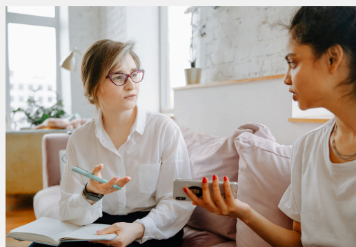
Asesoría y/o supervisión de casos (para psicólogos)