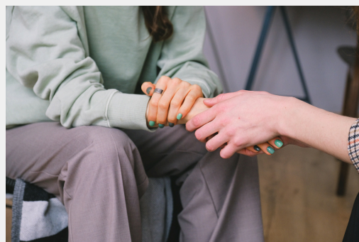
Terapias según modelo cognitivo