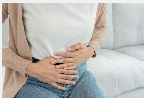
Transtornos de alimentación