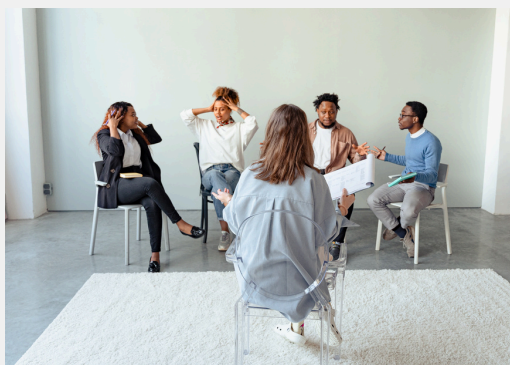
Terapias solicitadas por comisaria de familia o Fiscalía