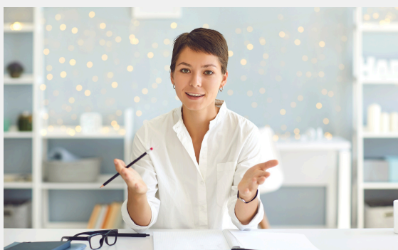
Aplicación de pruebas de personalidad