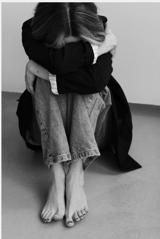
Manejo de ansiedad, depresión.